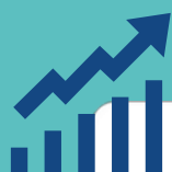
Etat d'avancement des actions et missions de notre CPTS en fonction des objectifs fixés